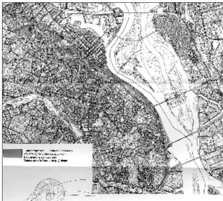
Територія пам'ятки ландшафту «Історичний ландшафт Київських гір і долини р. Дніпра»