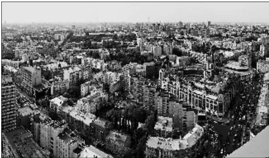
Панорама історичного центру Києва в районі початку вул. Великої Васильківської