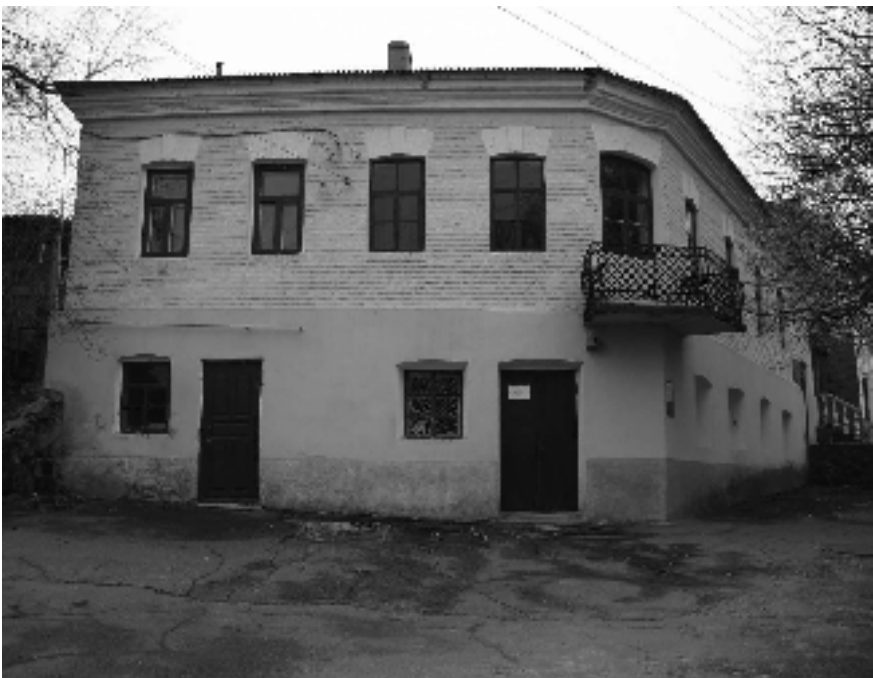
Будинок історичного музею. Вид з вул. Воровського