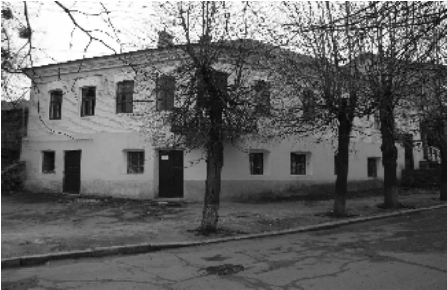
Будинок історичного музею. Вид з вул. Леніна