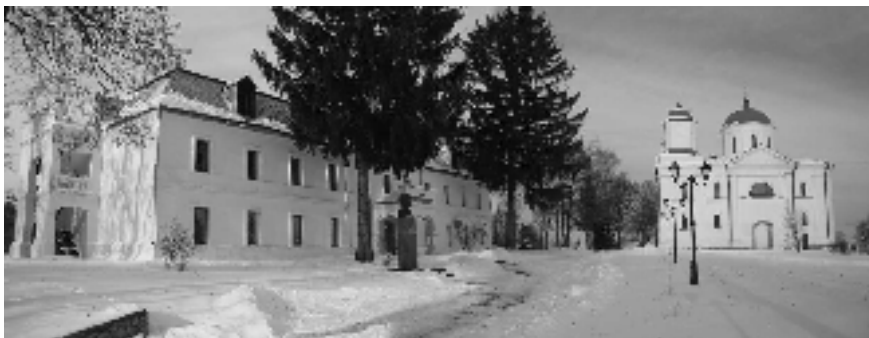
Загальний вигляд будівлі базиліанського училища та Успенського (Георгіївського) собору