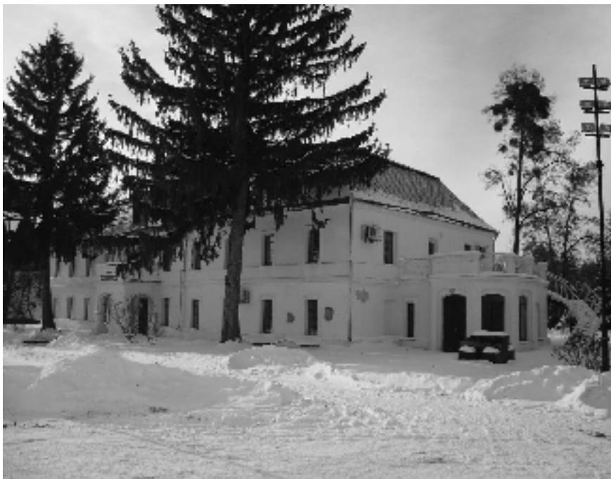
Будівля базиліанського училища. Вид від Успенського собору